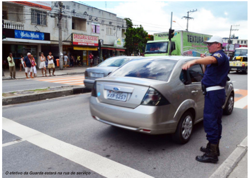
O efetivo da Guarda estará na rua de serviço

O objetivo da operação, não é punir, mas reduzir o número de acidentes que aumenta nesta época do ano, quando o número de veículos é maior e muitas vezes, os condutores apresentam um estado alterado por ingestão de bebida alcoólica.