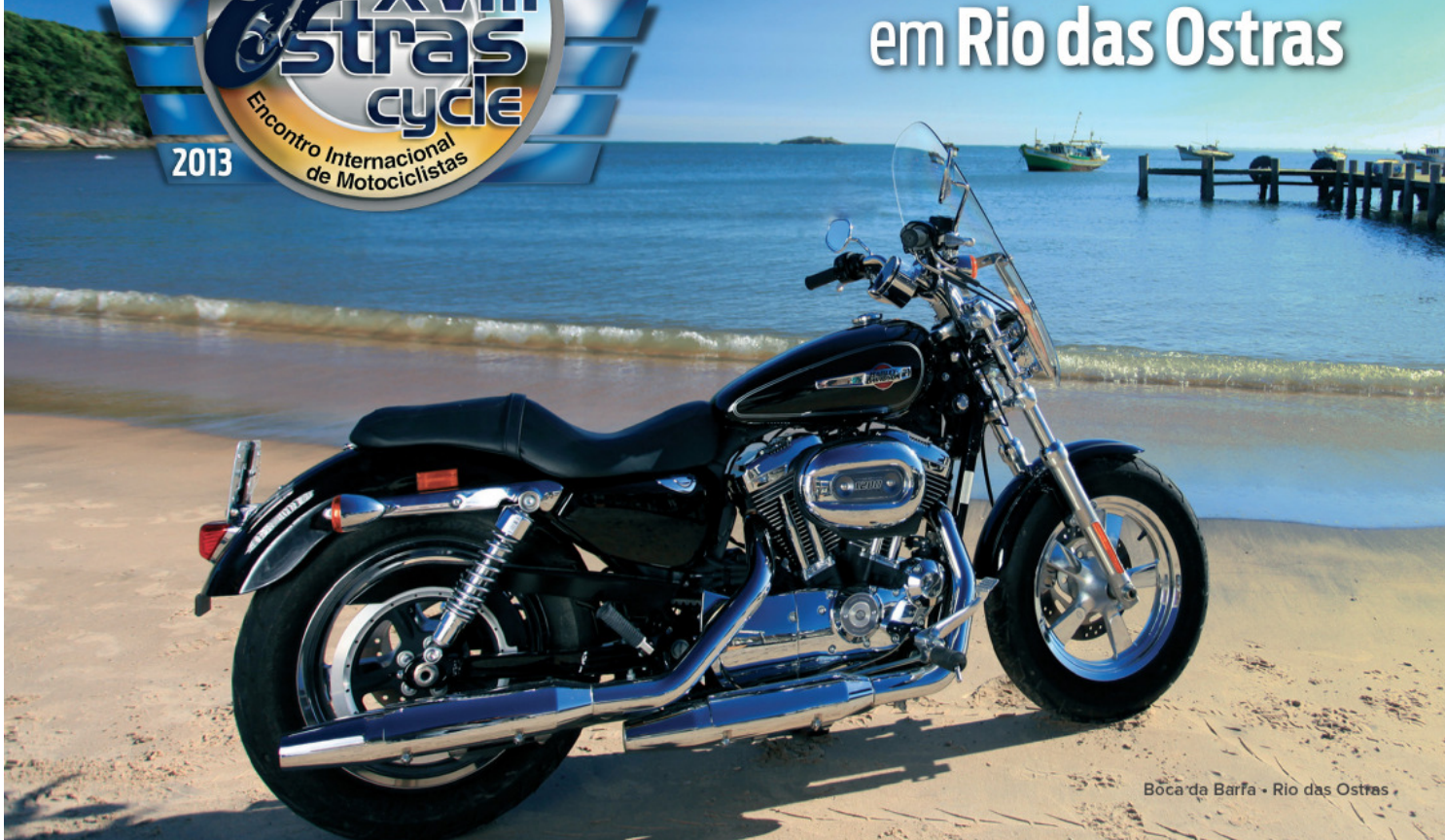
Boca da Barfa - Rio das Ostras