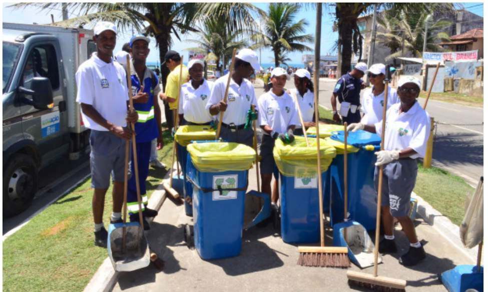
A equipe da limpeza estará preparada para entrar na pista e deixar as avenidas limpas

Para garantir que o carnaval de Rio das Ostras seja de paz, harmonia, alegria e segurança, a Administração Municipal está trabalhando de forma integrada com as Secretarias de Governo atuando em conjunto. Dentre as ações planejadas estão o aumento do efetivo nas ruas, a instalação de postos de atendimento médico em vários pontos da cidade, o fechamento de ruas e um esquema de coleta de lixo domiciliar diferenciado. Tudo será feito para que população e visitantes aproveitem a festa na cidade. A expectativa da Secretaria de Turismo é que a Cidade receba até 350 mil turistas.