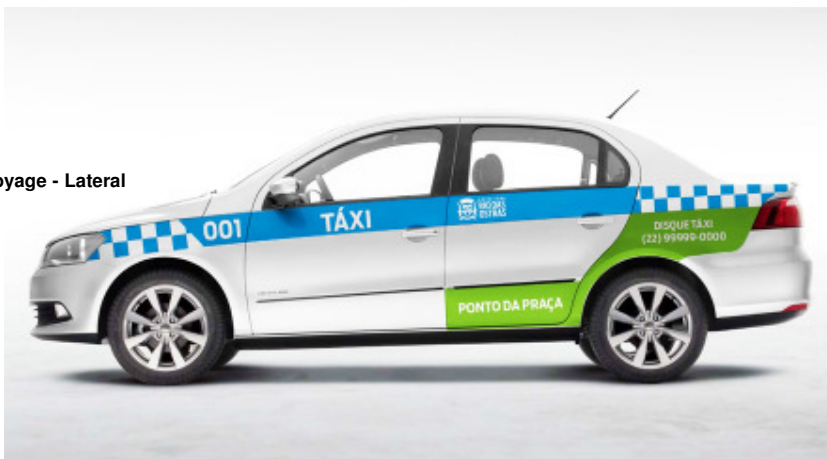
Voyage - Lateral