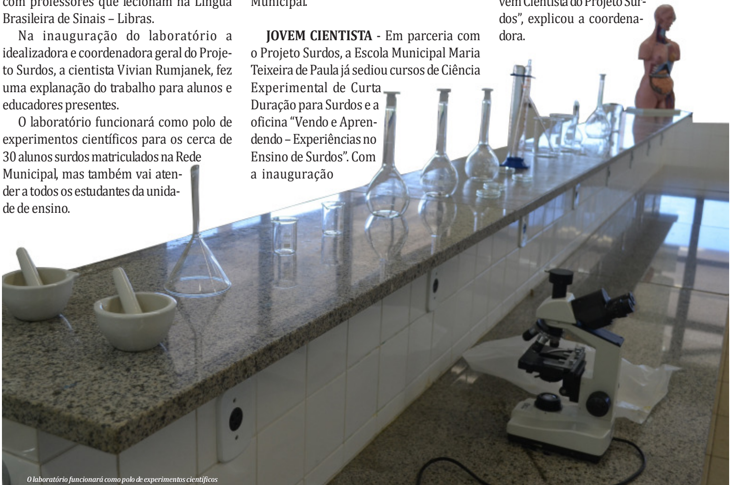
O laboratório funcionará como polo de experimentos científicos