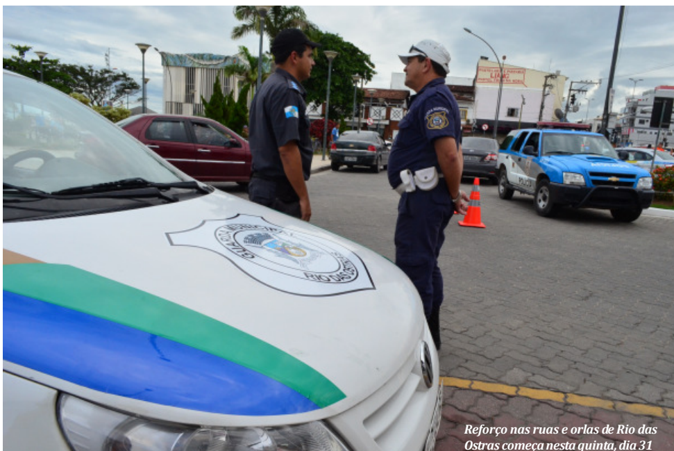
Reforço nas ruas e orlas de Rio das Ostras começa nesta quinta, dia 31

Eles vão se juntar aos 20 homens que já trabalham diariamente na cidade. Eles também irão atuar na equipe de PMs que está fazendo o patrulhamento de bicicleta na orla das praias do Centro, Bosque e Costazul. Os Policiais Militares irão contar com nove viaturas e duas motos para fazer o patrulhamento no Município.