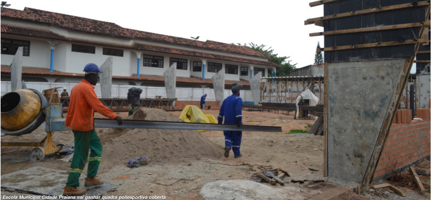
Escola Municipal Cidade Praiana vai ganhar quadra poliesportiva coberta

ACESSIBILIDADE - O projeto arquitetônico segue os padrões de acessibilidade, com mobiliário, espaços e equipamentos urbanos de acordo com as normas. A área contará com barras de apoio nos equipamentos sanitários, sinalizações visuais e táteis e rampas de acesso para portadores de necessidades especiais. A Escola Municipal Cidade Praiana conta com 15 alunos com deficiência matriculados atualmente.