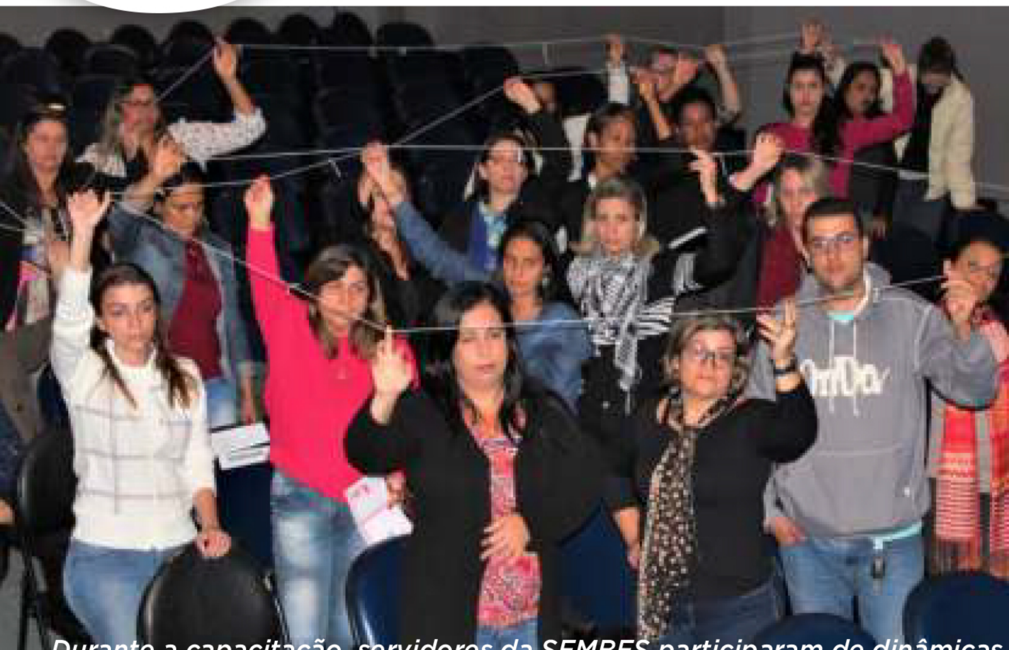
Durante a capacitação, servidores da SEMBES participaram de dinâmicas

As equipes da SEMBES e Guarda Municipal trabalharam para melhorar o fluxo de atendimento à população e os servidores do Centro de Defesa Ambiental adquiriram informações sobre a legislação ambiental.