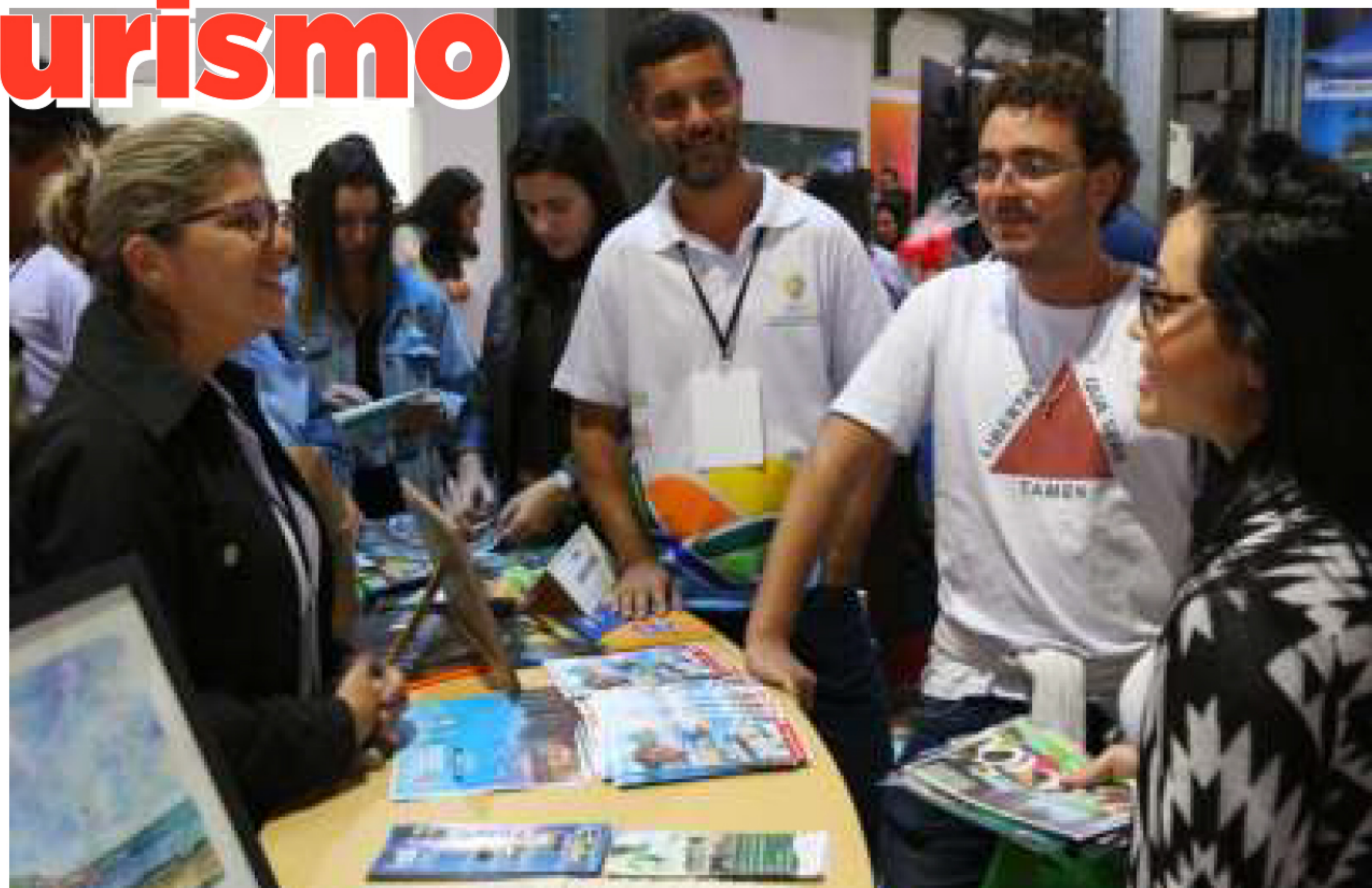
Mais de 3 mil pessoas visitaram o estande de Rio das Ostras na Feira de Turismo

O Salão do Turismo Rio de Janeiro reuniu, de 22 a 25 de agosto, no Armazém 2 do Pôr Mauá, no Centro, cerca de 75 municípios do Estado para divulgar as potencialidades e ampliar os negócios entre os diferentes agentes do setor turístico.