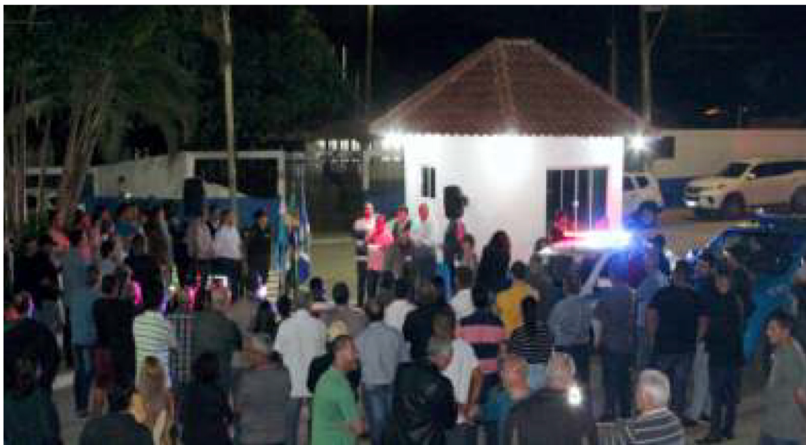
A população acompanhou a entrega da nova base de policiamento

Depois de Mar do Norte, agora foi a vez de Cantagalo receber uma Base Integrada de Segurança Pública, que já está funcionando 24h, todos os dias da semana, com homens da GM e PM, além de uma viatura exclusiva para o patrulhamento da localidade.