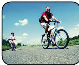
Pratique alguma atividade física