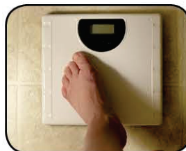
Controle seu peso