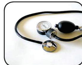
Meça sempre a pressão