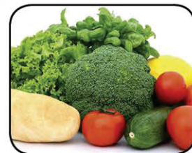
Tenha uma alimentação saudável