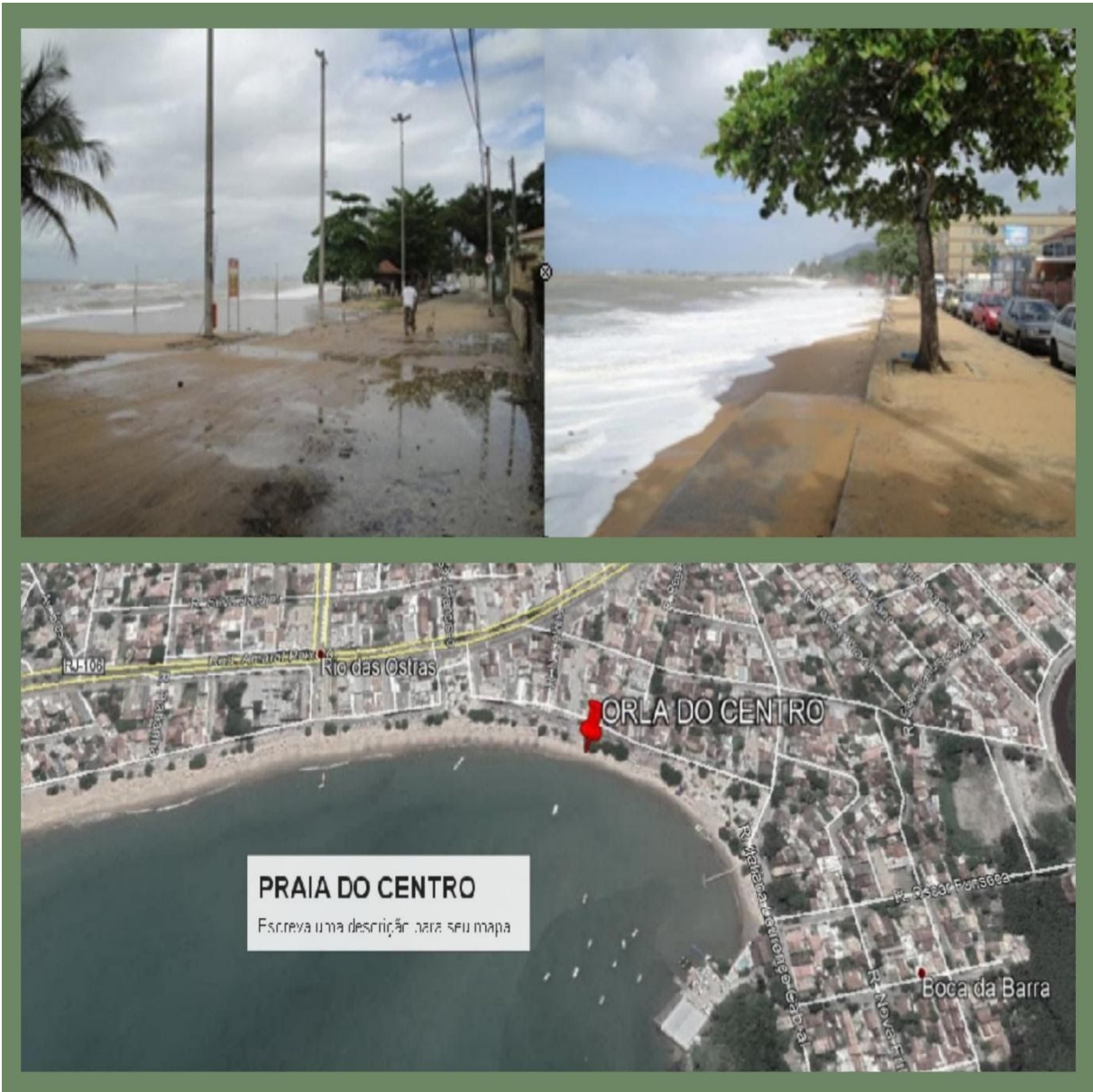
Ilustração da área afetada; Imagem Google Earth, E fotos de arquivo interno.