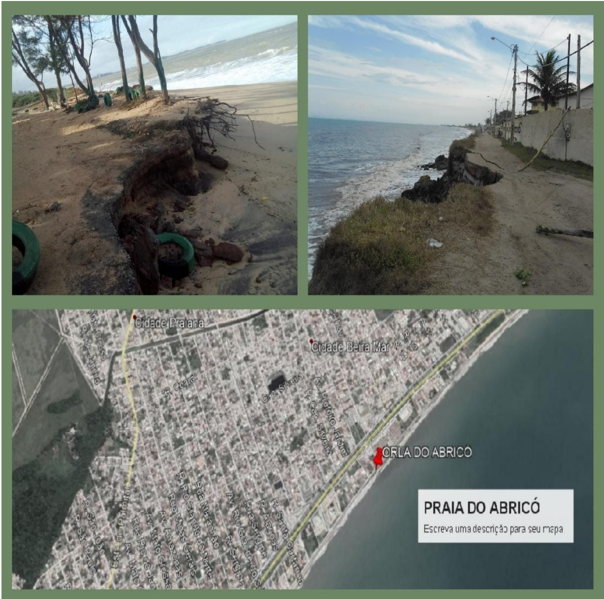
Ilustração da área afetada

Ponto de Apoio Desta Localidade: Escola Municipal Maria Teixeira de Paula.