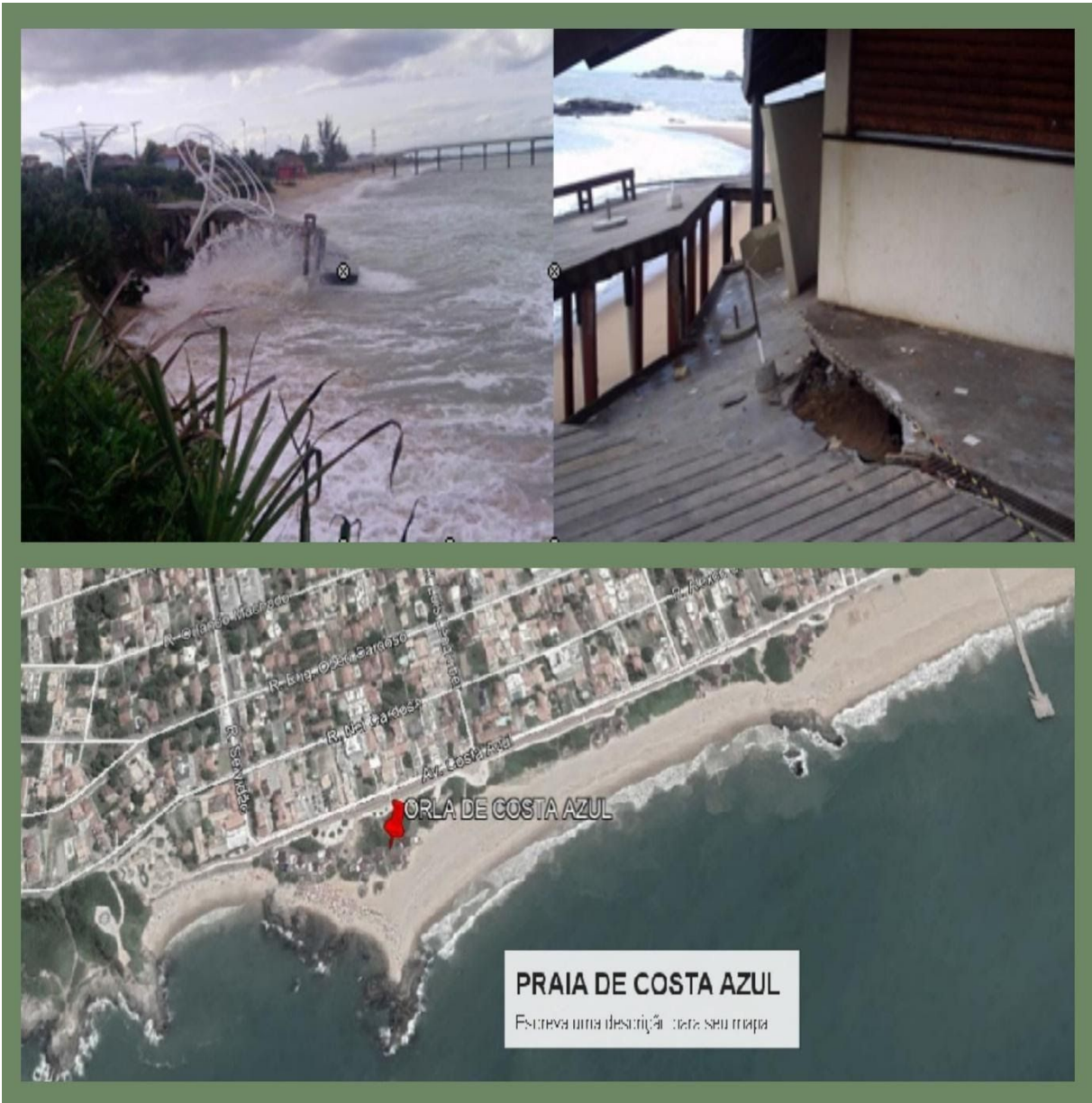
Ilustração da área afetada; Imagem Google Earth, E fotos de arquivo interno.