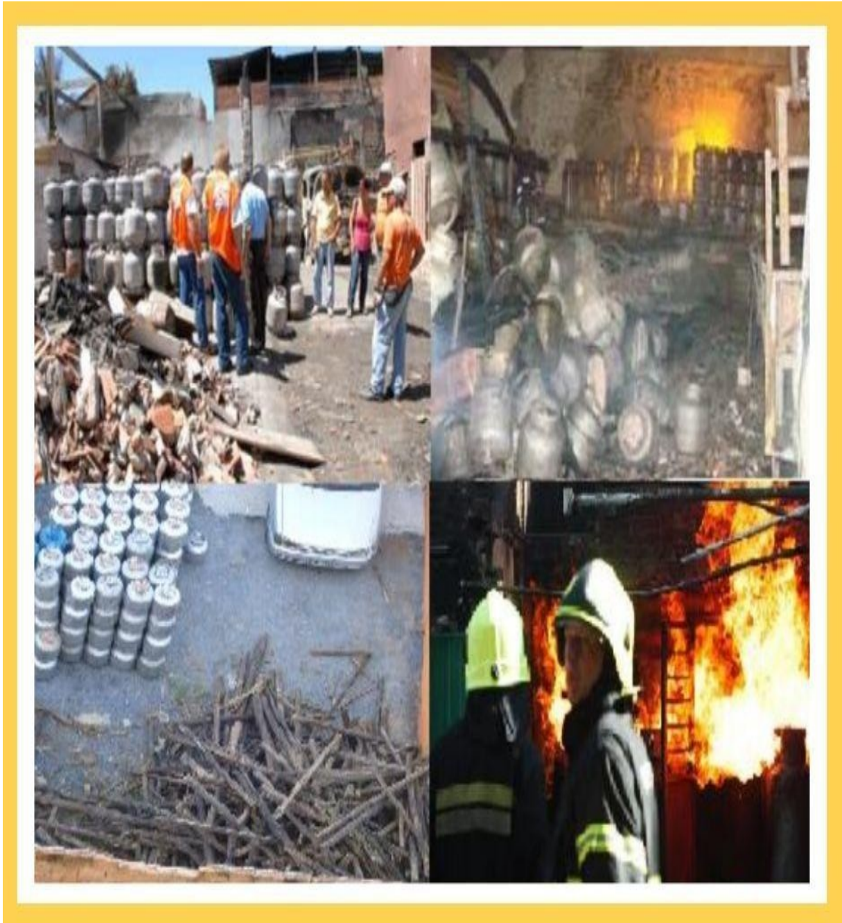
Imagens Ilustrativas/Fotos arquivos da Defesa Civil